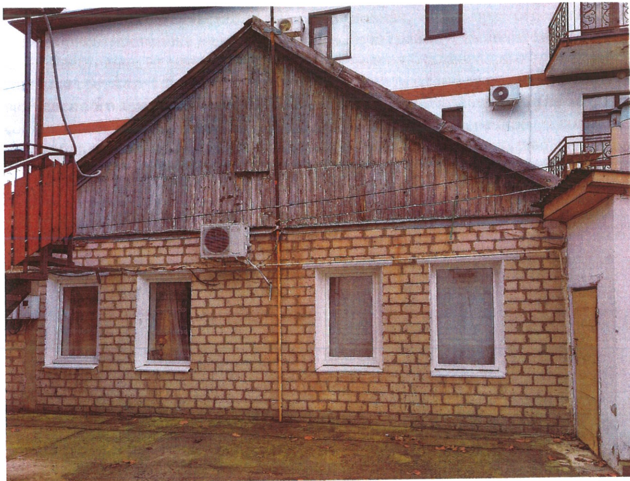
Фото 2. Строение, планируемое к демонтажу (вид в сторону западной межевой границы участка)

С северной стороны к застраиваемому участку 23:40:0201027:96 примыкает соседний застроенный участок (ул. Коллективная, д. 75б; кадастровый номер 23:40:0201027:114), на котором на расстоянии 3,0 м от межевой границы расположено трехэтажное жилое строение. Расстояние от планируемого к возведению жилого дома до межевой границы с северной стороны участка составит более 30,0 м. Таким образом, расстояние до окон строения, расположенного на соседнем участке, превысит минимальное значение 6,0 м и будет соответствовать градостроительным и противопожарным требованиям.