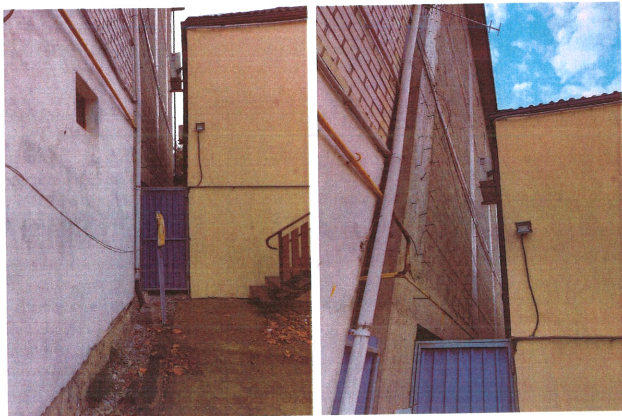
Фото 3. Строение на смежном участке с восточной стороны (ул. Революционная, б/н, кадастровый номер 23:40:0201027:169); вид на глухую стену соседнего строения

Расстояние от предполагаемого к возведению жилого дома до межевой границы составит 1,0 м, что является отклонением от предельных параметров разрешенного строительства в условиях сложившейся застройки (на момент составления заключения). Нотариально удостоверенное согласие правообладателей смежного земельного участка на строительство объектов жилой застройки на расстоянии 1,0 м от межевой границы имеется.