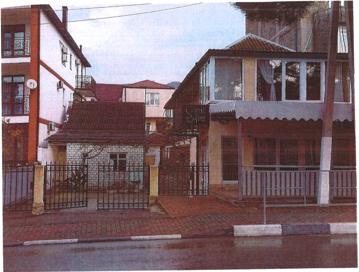
Фото 1. Вид со стороны ул. Революционная на фасад участка домовладения 72; кадастровый номер 23:40:0201027:96)

С западной стороны к застраиваемому земельному участку 23:40:0201027:96 примыкает соседний застроенный участок (ул. Революционная, д. 72; кадастровый номер 23:40:0201027:97), на котором на расстоянии 1,0 м от межевой границы расположено трехэтажное жилое строение (фото 2). Имеются оконные проемы, выходящие в сторону застраиваемого участка. Расстояние планируемого к строительству жилого дома до окон соседнего трехэтажного жилого строения составит 6,0 м.