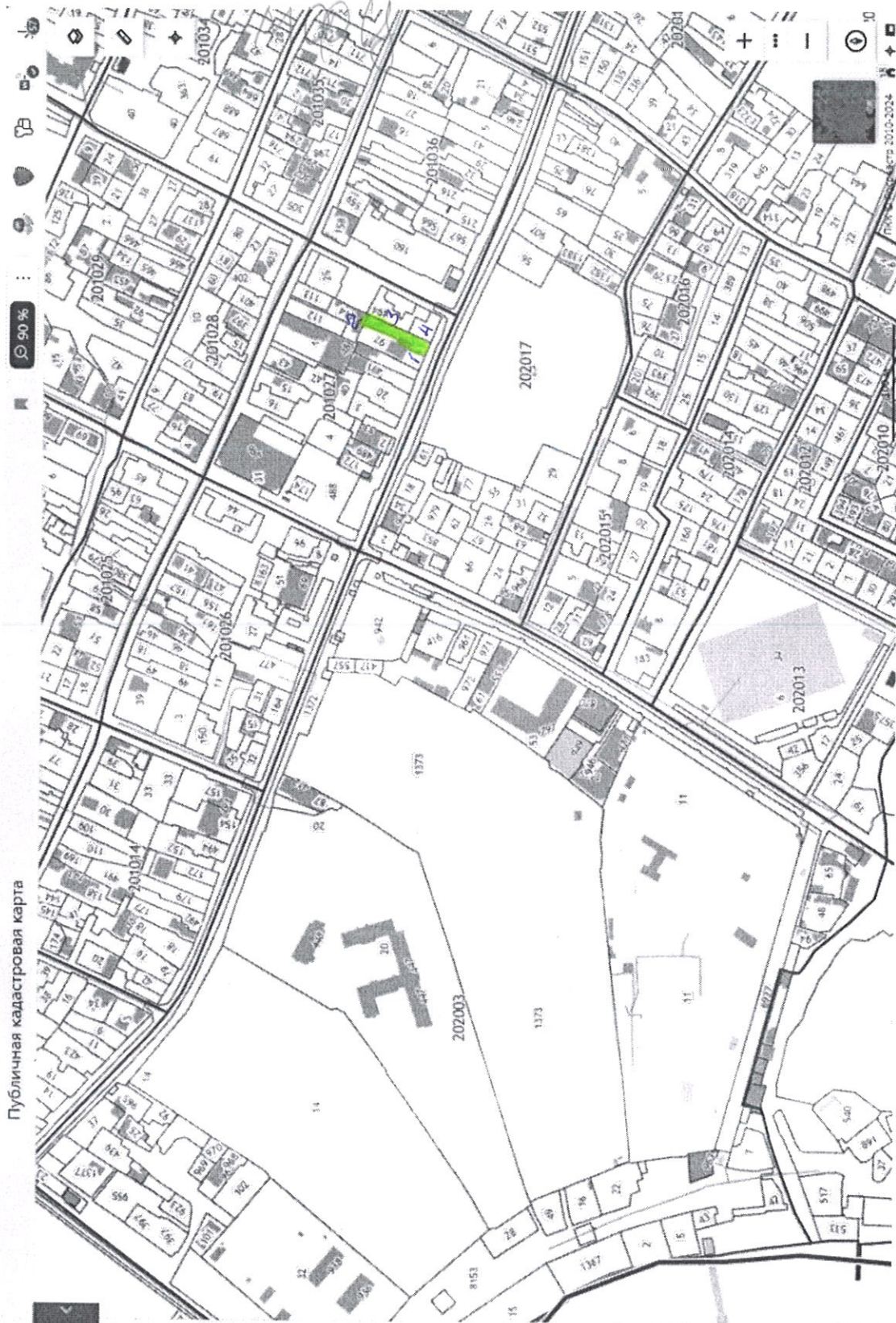
Публичная кадастровая карта