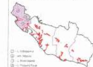
Схема расположения населенных пунктов на территории Кабардинского сельского округа